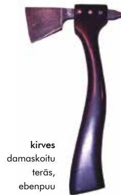
kirves damaskoitu teräs, ebenpuu