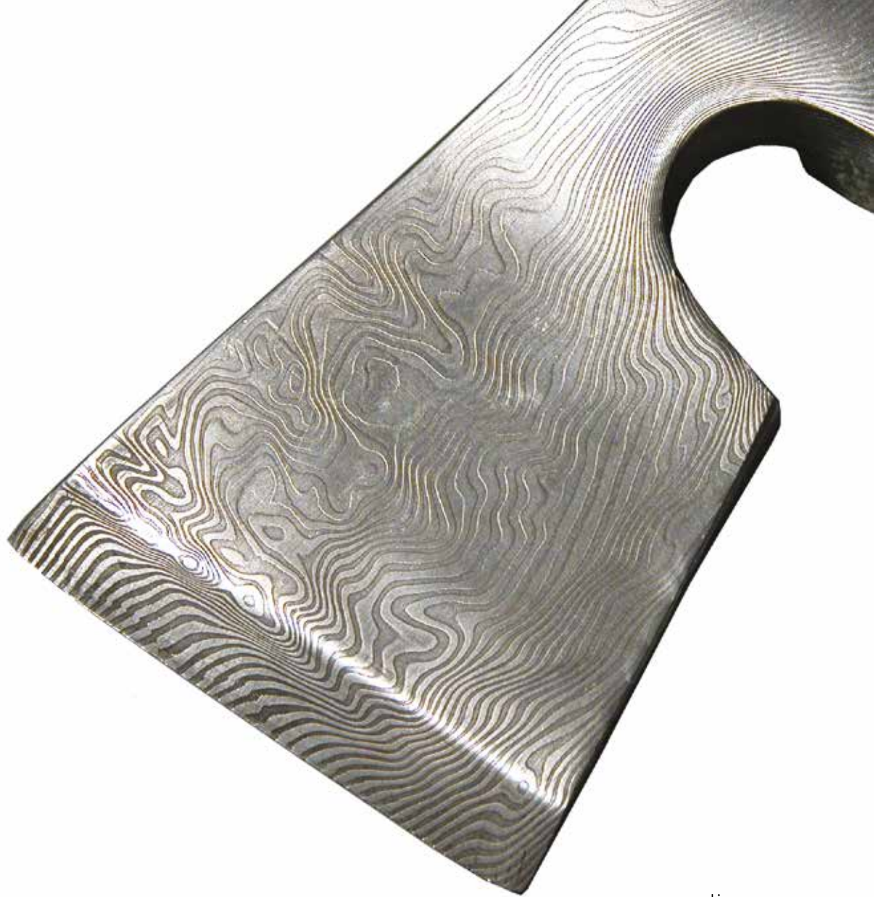
kirves damaskoitu teräs