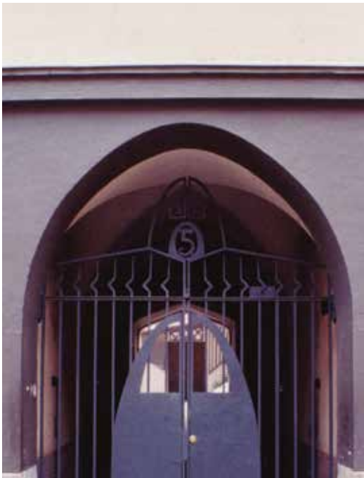
portti Vuorimiehenkatu 19, Helsinki