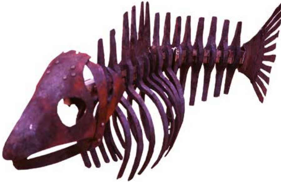
kala teräs, ruostumaton teräs

Pieniä esineitä ja ajatuksia leijaillee ympäri työpöytiä ja luonnoslehtiöitä.