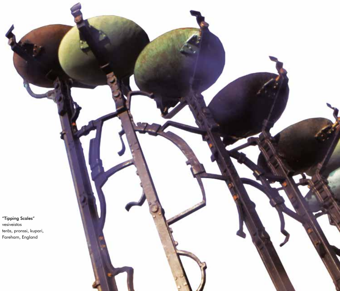
"Tipping Scales" vesiveistos teräs, pronssi, kupari, Fareham, England