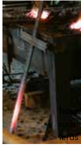
hautaristi kuolleet teräs

Joskus ovesta astuu sisään asiakas, jonka elämässä aika on pysähtynyt, pystyttänyt merkkipaalun elämä ennen tätä ja tästä eteenpäin. Kuolema, kutsumaton vieras, joka välillä ojentaa kylmän kätensä ja vie mukanaan odottamatta ne, joista emme vielä haluaisi luopua. Joskus tullen kuin kaivattu ystävä, kuiskaten lohduttavia sanoja korvaamme kietoo viittaansa ja saattaa meidät pois tästä elämästä. Aina kuitenkin jättäen jälkeensä surun, jonka aika armeliaasti muuttaa muistoiksi. Hautamuistomerkkejä tehdessäni ryhdyin kysymään miksi, kun useana vuotena peräkkäin luokseni tuli vain vanhempia, joilta oli kuolleet lapsi. Kysymys ympäröi koko heidän olemuksensa ja vastauksen omaani sain, kun hetken saatoin kokea, kuinka omalla työlläni pystyin osaltani auttamaan heitä tästä eteenpäin. Surusta rakennetaan kuva, konkreettinen merkki, joka kertoo, että aika pysähtyi vain sillä kohtaa.