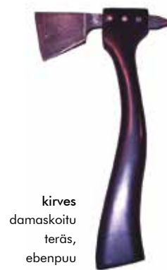
kirves damaskoitu teräs, ebenpuu