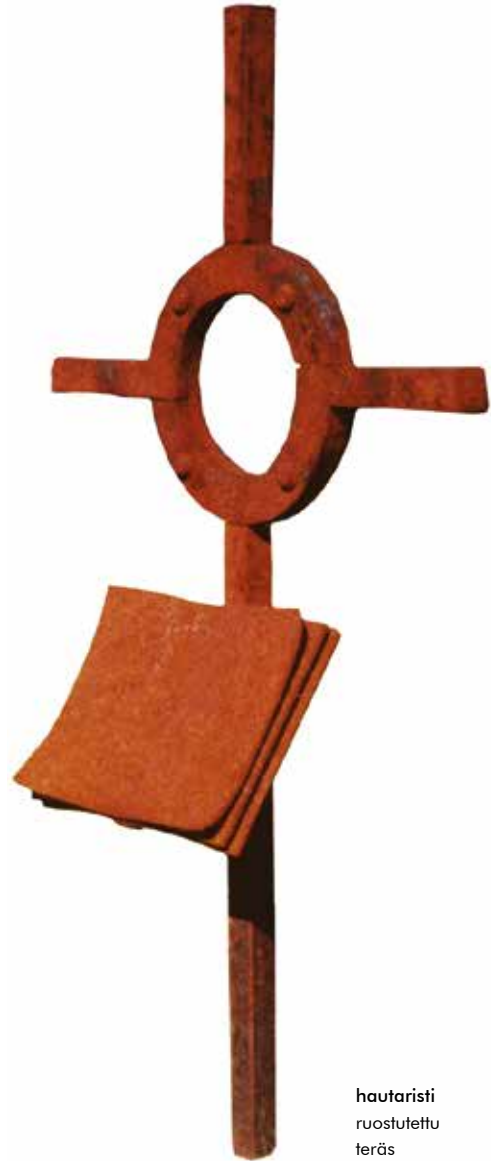
hautaristi ruostutettu teräs

Joskus ovesta astuu sisään asiakas, jonka elämässä aika on pysähtynyt, pystyttänyt merkkipaalun elämä ennen tätä ja tästä eteenpäin. Kuolema, kutsumaton vieras, joka välillä ojentaa kylmän kätensä ja vie mukanaan odottamatta ne, joista emme vielä haluaisi luopua. Joskus tullen kuin kaivattu ystävä, kuiskaten lohduttavia sanoja korvaamme kietoo viittaansa ja saattaa meidät pois tästä elämästä. Aina kuitenkin jättäen jälkeensä surun, jonka aika armeliaasti muuttaa muistoiksi. Hautamuistomerkkejä tehdessäni ryhdyin kysymään miksi, kun useana vuotena peräkkäin luokseni tuli vain vanhempia, joilta oli kuolleet lapsi. Kysymys ympäröi koko heidän olemuksensa ja vastauksen omaani sain, kun hetken saatoin kokea, kuinka omalla työlläni pystyin osaltani auttamaan heitä tästä eteenpäin. Surusta rakennetaan kuva, konkreettinen merkki, joka kertoo, että aika pysähtyi vain sillä kohtaa.