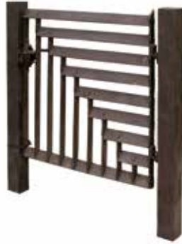
portti Paju Book City, South Korea